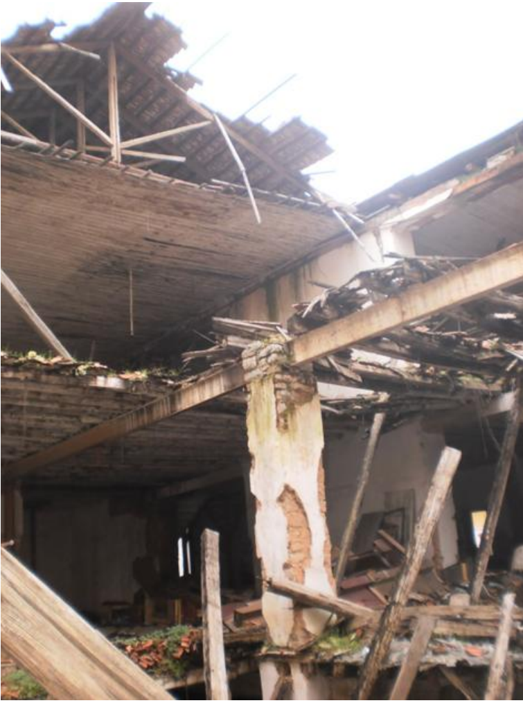
Φωτο 3. Εσωτερικό κτηρίου