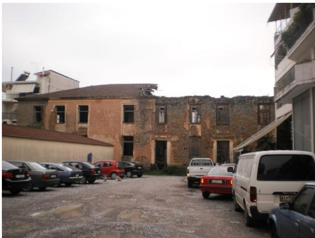
Φωτο 2. Ανατολική όψη