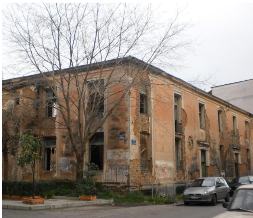
Φωτο 1. Άποψη από τη συμβολή των οδών Μεσολογγίου και Πατταϊωάννου